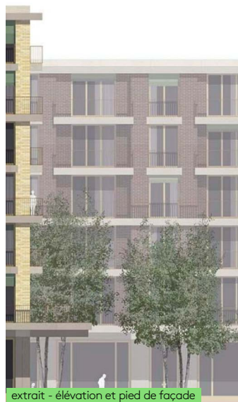
extrait - élévation et pied de façade

Situé au Nord de la gare de Langenthal, un nouveau quartier d'habitation est projeté par la ville en lieu et place d'un secteur industriel et des installations liées aux CFF.