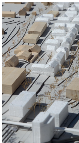
photos de maquette

Projet de requalification urbaine majeure à l'échelle de la commune avec recherche de nouvelles connexions entre les quartiers anciens, nouveaux et futurs. Utilisation de la densification du bâti pour redonner qualité et sens aux espaces publics. Le maître de l'ouvrage public, assisté par un bureau de conseil (urbaplan) a souhaité la mise en place d'un processus participatif en accompagnement du développement des études, avec intégration des habitants intéressés dans les groupes de suivi